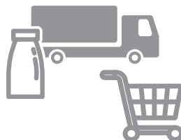
加工・流通・販売