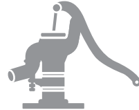
農業用の井戸・水道