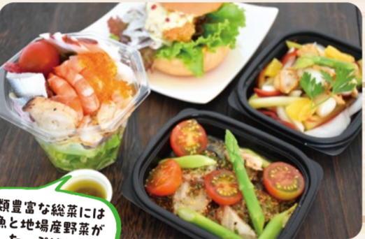
種類豊富な総菜には 鮮魚と地場産野菜が たっぷり!