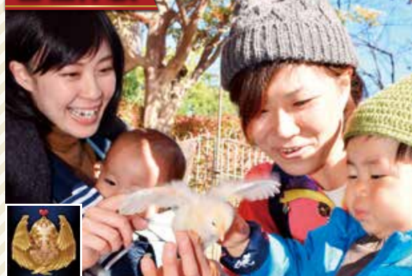
子どもたちに人気の各種体験をたくさん用意！