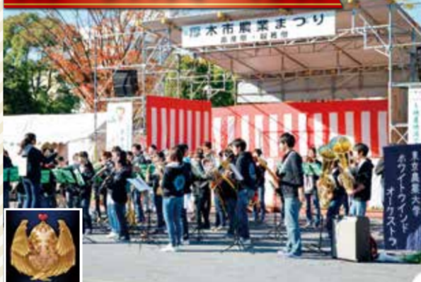
迫力あるダンス・演奏、豪華商品が当たる抽選会などを開催！