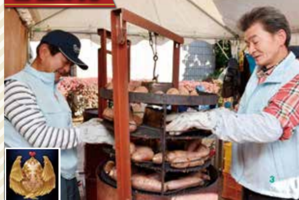
農畜産物をはじめ、加工品や鉢花、植木など、多くのブースが並びます！