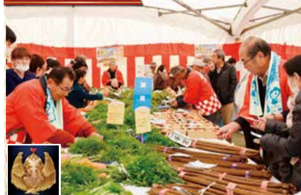
管内の新鮮な野菜や果物、花などが勢ぞろいします！